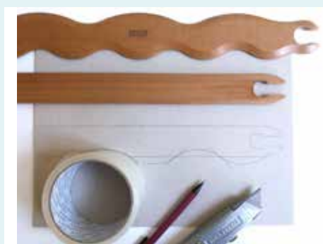
Instructie eigen golfsteeklat

Weef linnenbinding. Het werkt prettig om een aparte steeklat te gebruiken voor het inslaggaren en de golfsteeklat alleen te gebruiken voor het creëren van de golven. Sla in maar sla niet aan met het weefriet. Gebruik de golfsteeklat om de inslag aan te duwen. In de voorbeelden is wol gebruikt voor schering en inslag. Het is op vier draden per centimeter geweven. Het weefsel met blauwe inslag is Shetland lamswol gelijk aan de schering. De proeflap met blauw kleurverloop is enkeldraads handgeverfde wol. Tenslotte is het gele weefsel ingeslagen met tweedraads getwijnd kleurverloop wol met superwash afwerking. Bij het proefweefsel met de gele inslag zijn de golven na het wassen het mooist gebleven en het minst gekrompen. De superwash afwerking van het inslaggaren zal hier een rol in spelen.