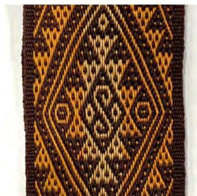
Pebbleweefsel Fenny Nieuwman

Pebble is het Engelse woord voor kiezel. Een pebbleweefsel wordt dan ook gekenmerkt door kiezeltjes of stippeltjes in het basisweefsel. Twee bindtoeren wisselen elkaar af met de patroontoeren, waarbij in de bindtoeren telkens twee draden naast elkaar gebonden worden en twee niet. In de patroontoer worden telkens twee of een even aantal draden opgenomen. De paren van de patroontoeren en die van de bindtoeren zijn één draad ten opzichte van elkaar verschoven. Tijdens het weven werk je in paren van een lichte en donkere draad. Neem je de lichte draad van een paar op, dan laat je de bijbehorende donkere draad vallen en andersom. Een pebbleweefsel is een complementair weefsel. Dat betekent dat voor- en achterkant hetzelfde patroon tonen, alleen in tegengestelde kleurstelling. Een pebbleweefsel is ook geschikt om met meer kleurlagen te weven. Zeer ervaren bandweefsters weven soms wel met zes verschillende kleurlagen.