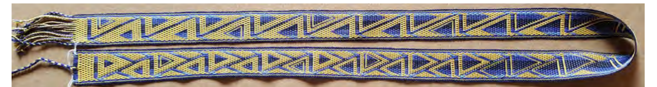
Eenvoudige pick-up Lieve Claerbout