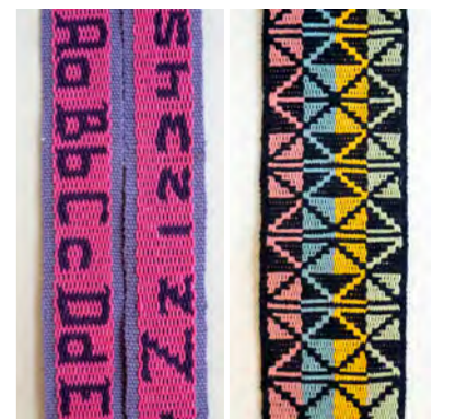
Intermesh en Modified Intermesh Willy Kroon

Intermesh lijkt, wat de techniek betreft, veel op de pebbletechniek. Echter daar waar bij de pebbletechniek de bindtoeren afwisselend om en om uit twee draden van de verschillende kleuren bestaan, is dit bij de intermesh-techniek om en om uit één draad. Ook bij deze techniek hebben we twee verschillende bindtoeren. Modified intermesh is bijna gelijk aan de intermeshtechniek, maar nu worden in de bindtoeren ook extra draden opgenomen of weggedrukt.