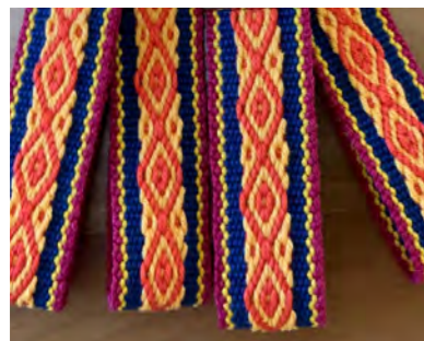
Pebbleweefsel Marion Verloop

Bij de pick-uptechniek wordt als basis een opzet gebruikt met afwisselend lichte en donkere horizontale strepen. Een patroon wordt gevormd door draden vanuit de onderliggende laag naar boven te halen, zodat deze in de bovenlaag flotten. Aan de achterkant van het weefsel is de inslagdraad zichtbaar op de plekken waar de draad is opgenomen. Een patroon kan al ontstaan door op slechts enkele plaatsen een draad op te pakken. Complexere patronen kunnen gemaakt worden door in elke toer meerdere draden op te nemen, waarbij zelfs de basis van de strepen niet meer zichtbaar is.