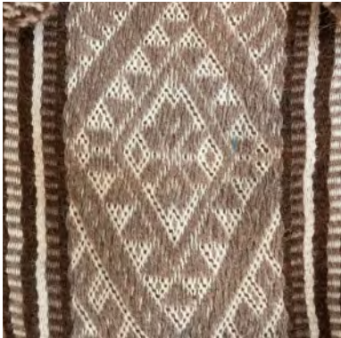
Q'ero Willy Kroon

De Baltic-styletechniek werkt, anders dan de meeste van de hiervoor beschreven technieken, niet met een basisstructuur van streepjes waarbij elke kettingdraad een rol kan spelen in het patroon. Bij Baltic style werk je uitsluitend met patroondraden om motieven te vormen. De patroondraden, vaak van een wat dikker materiaal, worden omgeven door twee achtergrond-draden. Patroondraden liggen afwisselend in de gehevelde en ongehevelde laag. Motieven worden gevormd door patroondraden op te nemen of juist te laten vallen.