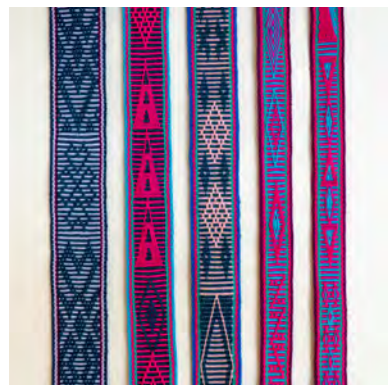
Eenvoudige pick-up Willy Kroon

Als er ergens een verscheidenheid aan opneemtechnieken te vinden is, dan is het in het bandweven. De basisopzet van een band bestaat, in de meeste gevallen, uit twee lagen. Op een inkleloom zijn dit de gehevelde en de ongehevelde laag. Een bandweefsel is meestal een kettingrips; de inslagdraad is niet zichtbaar. De eenvoudigste manier om patronen te maken, is door verschillende kleuren in de ketting op te spannen. Maar er zijn veel meer mogelijkheden door het toepassen van opneemtechnieken, waarbij je een rand en een patroongedeelte hebt. In het patroongedeelte span je draden met een donker/licht-verschil op en worden patronen gevormd door kettingdraden over meerdere inslagen te laten flotten. Bij een aantal andere technieken speelt ook de inslagdraad een rol om motieven te vormen. Om de mogelijkheden in het bandweven te laten zien, zetten we in dit artikel een aantal technieken op een rij.