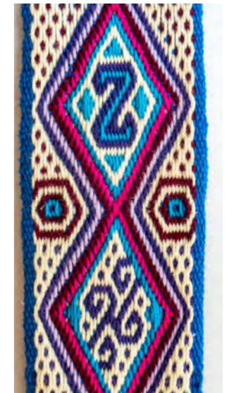
Pebble met 6 kleurlagen Willy Kroon