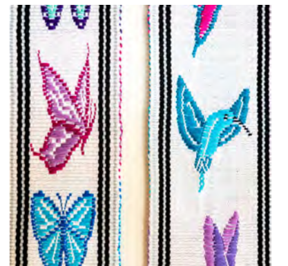
Brocheren Willy Kroon

Bij brocheren is de basis meestal een effen lichte band. Je werkt met twee inslagdraden: een dunne draad om de kettingdraden te binden en een dikkere, toegevoegde inslagdraad. Per toer neem je een aantal draden op, waarmee je de toegevoegde inslagdraad bindt. Deze toegevoegde draad loopt over de resterende kettingdraden heen en vormt daarmee het motief.