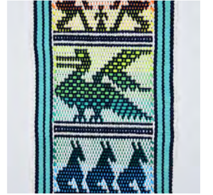
Totonicanpan Karoline Storm

De Totonicanpanstructuur lijkt zeer sterk op de eenvoudige pick-upstructuur: er worden vanuit een horizontale streepjesopzet telkens twee draden naast elkaar opgenomen om patronen te vormen. Een groot verschil is dat er met een extra inslagdraad wordt gewerkt onder de opgenomen draden, waardoor zeer kleurige banden gemaakt kunnen worden. Hiervoor wordt meestal een iets dikkere draad wol gebruikt of borduurgaren.