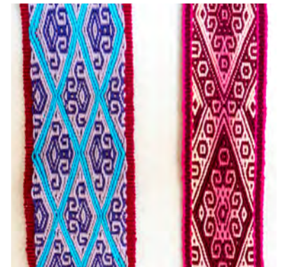
Keper Willy Kroon

Een keperband komt wat betreft de manier waarop deze band gewoven wordt sterk overeen met een pebbleweefsel. Ook hier werk je met paren van lichte en donkere draden en is het weefsel complementair. De structuur is echter heel anders. In elke toer worden binddraden opgenomen zowel in het motief als in de achtergrond in een 2 – 1 – 2 ritme. In de achtergrond zie je bijvoorbeeld tussen 2 draden achtergrondkleur 1 draad in de patroonkleur. Door meerdere draden van de patroonkleur op te nemen ontstaat het patroon.