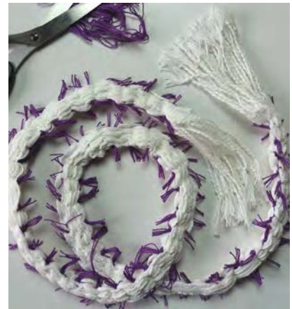
9 Knip de uiteinden af, zodat meer verfstof in het weefsel gaat zitten