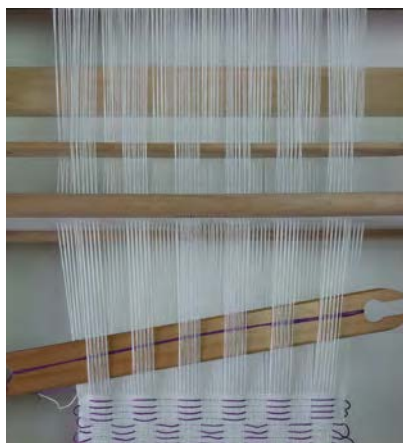
2 Selectielat op zijn kant, sla in met patroondraad