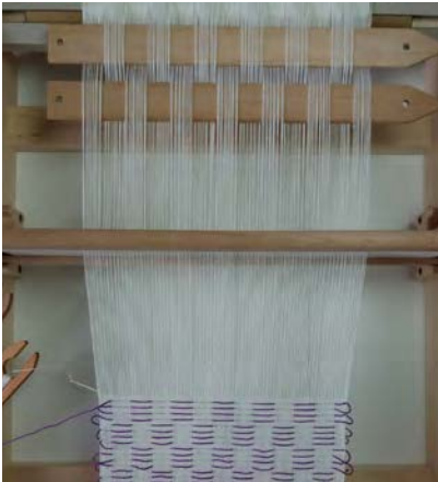
4 Gebruik een tweede selectielat om het patroon te laten verspringen