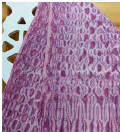
11 Close-up resultaat na verfbad met cochenille, grondig uitspoelen en drogen

Meer weten over Shibori? Boek The Weaver's Studio Woven Shibori – Catharine Ellis Website geborduurde shiboritechniek janecallender.com