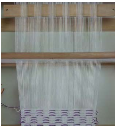
1 Selecteer om en om tien draden achter het riet