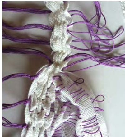
8 Trek nu 2-3 lussen aan de andere zelfkant stevig aan, zet vast met platte knoop