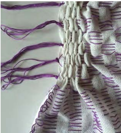
7 Trek aan één zelfkant 2-3 lussen bij elkaar met een overhandse knoop