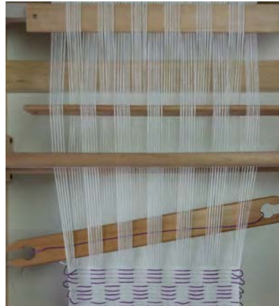
5 Tweede selectielat op zijn kant, sla in met patroondraad