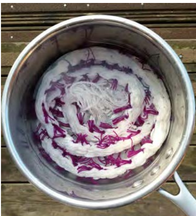
10 Week het weefsel één nacht in water voordat je volgens eigen procedé gaat verven. Knip overhandse knoop los, trek draad er uit