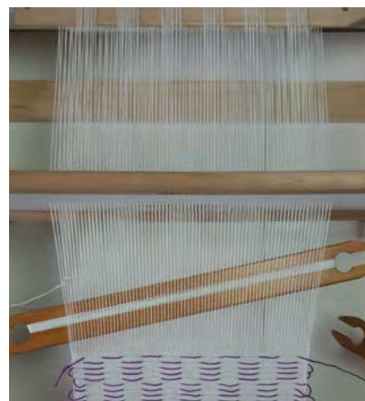
3 Weef drie keer linnenbinding na elke patrooninslag