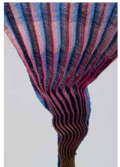
Shiboriweefsel van dun papiergaren en polyester naaigaren