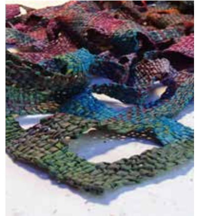
Landschapje waarbij papiergaren kreukelt als het nat is en zo blijft in opgedroogde vorm