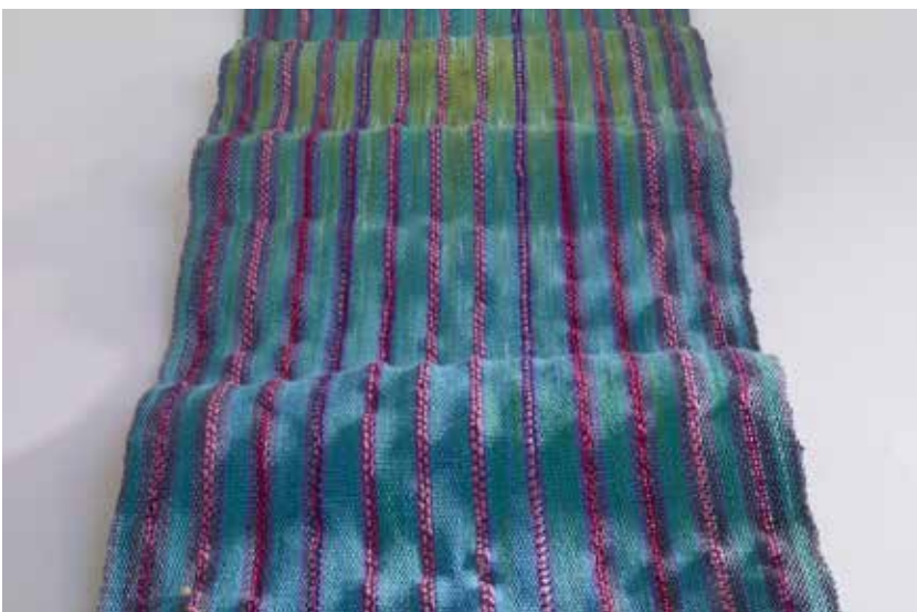
16/2 katoenen ketting en rond papiergaren