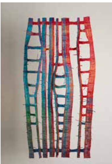
Landschapje van 'gevouwen' papiergaren met golvende lijnen

In mijn weefwerk gebruik ik bijna altijd linnenbinding omdat ik vind dat veel materialen daar het mooiste in uitkomen, zoals het papiergaren dat te zien is op de foto 'landschapje van 'gevouwen' papiergaren met golvende lijnen'. Elke extra structuur zou alleen maar afleiden van het papier. Toch ben ik ook gefascineerd door de ontelbare weeftechnieken die er zijn. Ik kan uren staren naar plaatjes van weefsels, ze uitvergroten, en me afvragen hoe ze gemaakt zijn. Zo verdiepte ik me deze weken in taqueté, samiet en lampas, hele oude technieken en waagde ik me aan een driedubbelweefsel. Dat laatste puur als puzzel, om te kijken of het me zou lukken. Ik zal daar niet meteen een groot werkstuk mee maken maar er komt ongetwijfeld een moment waarop deze nieuwe kennis van pas gaat komen!