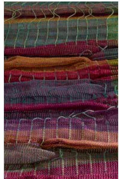
Dun en dikker papiergaren waarbij flotteringen structuren vormen

Zo is mijn ontdekkingstocht in de weefwereld nog lang niet tot stilstand gekomen!